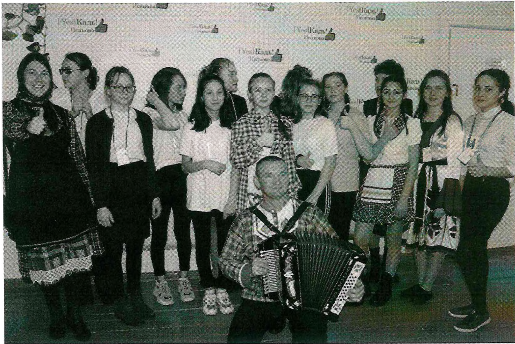
Выступление на родительском собрании