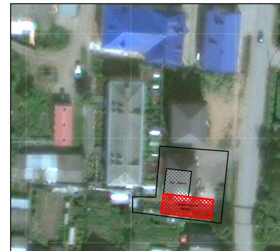
Экспликация к СПОЗУ